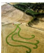
La Pavoncella Sarda