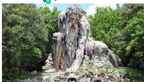
FIRENZE, Villa Demidof, Colosso dell'Appennino del Giambologna