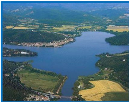
Lago di Piediluco