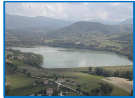
Diga de l'Aia (Lago di Recentino)