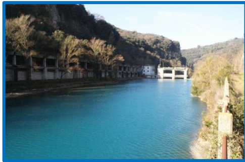
Stifone, Diga di La Morica