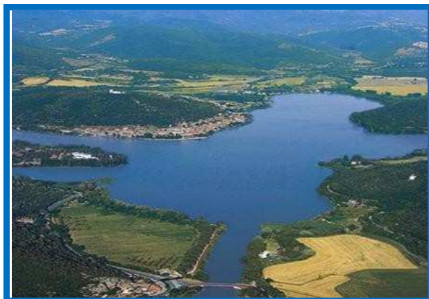
Lago di Piediluco